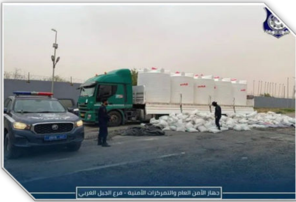
دهاز الأمن العام والمرحبات الأمنية - فرع الجبل الغربي

أعلن جهاز دعم الاستقرار، في 2 يونيو 2024، ضبط شاحنتي تهريب وقود جنوب مدينة غريان. وبحسب بلاغ للجهاز، فقد تمكن مكتب غريان في نقطة تفتيش أمنية ببوابة القضاة جنوب مدينة غريان من ضبط شاحنتين محملتين بما قدره 60 ألف لتر من وقود الديزل